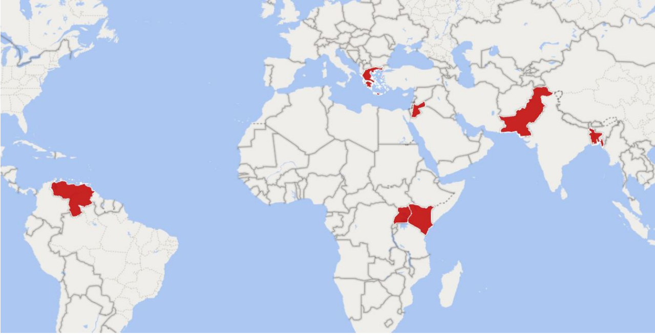
Harita 1: KOVID-19 küresel salgını döneminde mültecilerin yüksek risk altında olduğu bölgeler: Bangladeş: Kutupalong, Kenya: Kakuma Kampı, Midilli Adası: Moria Kampı, Pakistan: Kuzey Batı Sınır Eyaletleri, Uganda: Bidibidi Kampı, Ürdün: El Zatari Kampı ve Venezüella merkezli göçmenlerin durumu