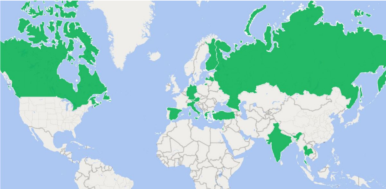
Harita 2: KOVID-19 küresel salgını döneminde zira-tarımsal üretim başta olmak üzere ekonomilerinin sürdürülebilirliği için geçici göçmen emeğine ihtiyaç duyan ve bu alanda acil politikalar geliştiren ülkeler: Almanya, Avusturalya, Dubai, Finlandiya, Hindistan, İngiltere, İspanya, İsrail, İtalya, Kanada, Katar, Letonya, Rusya, Singapur, Tayland, Türkiye ve Yunanistan.